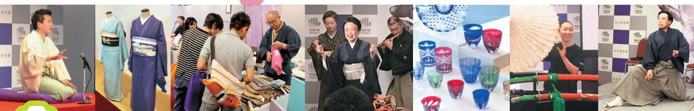
『歌舞伎と手仕事 第2弾』会場風景